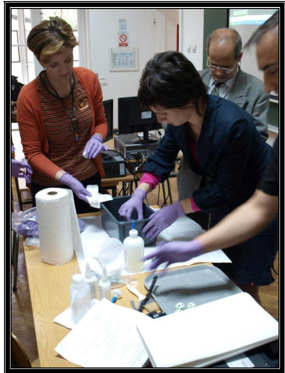
Накнадна обрада 3D модела у циљу побољшања механичких особина