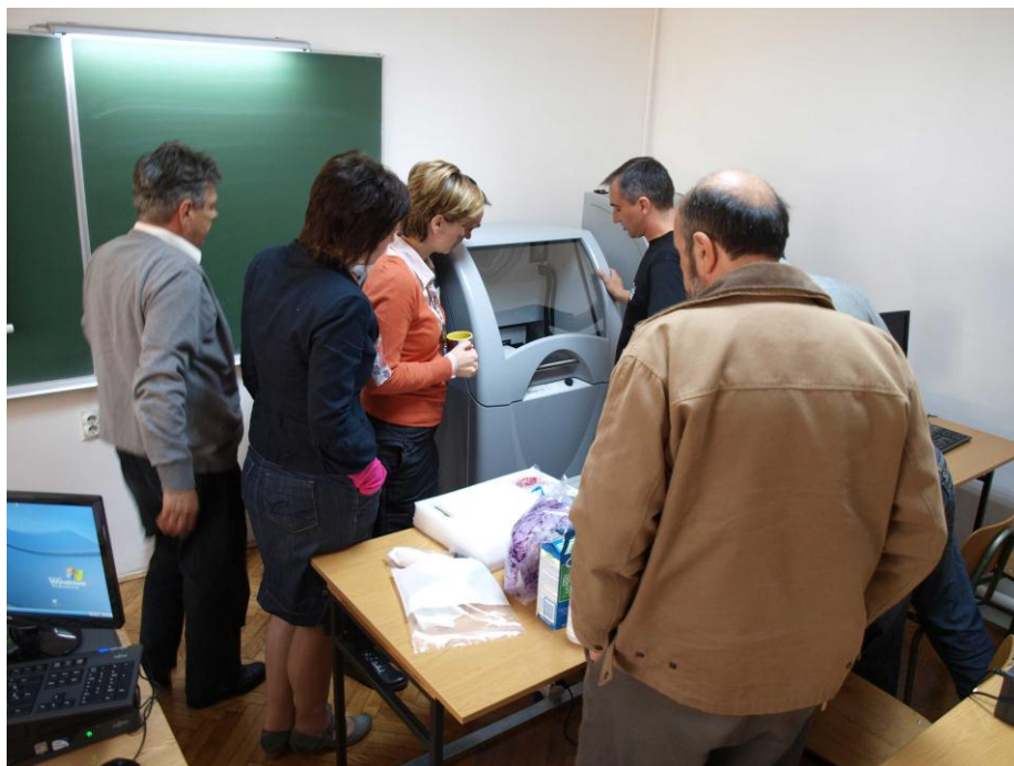
Штампање тродимензионалног модела на 3D штампачу ZPrinter 250