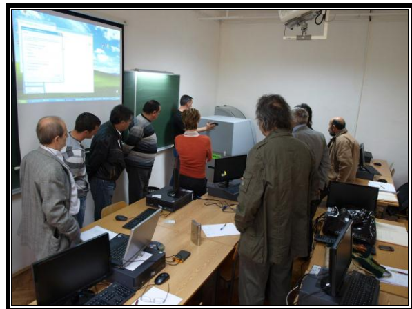
Инсталација колор 3D штампача ZPrinter 250 у Високој техничкој школи струковних студија у Новом Саду